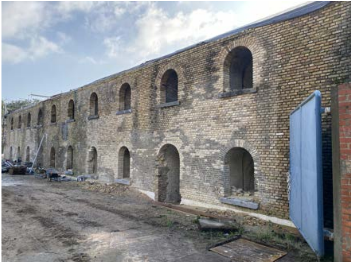
De gerestaureerde noordelijke zijmuur, toestand december 2025