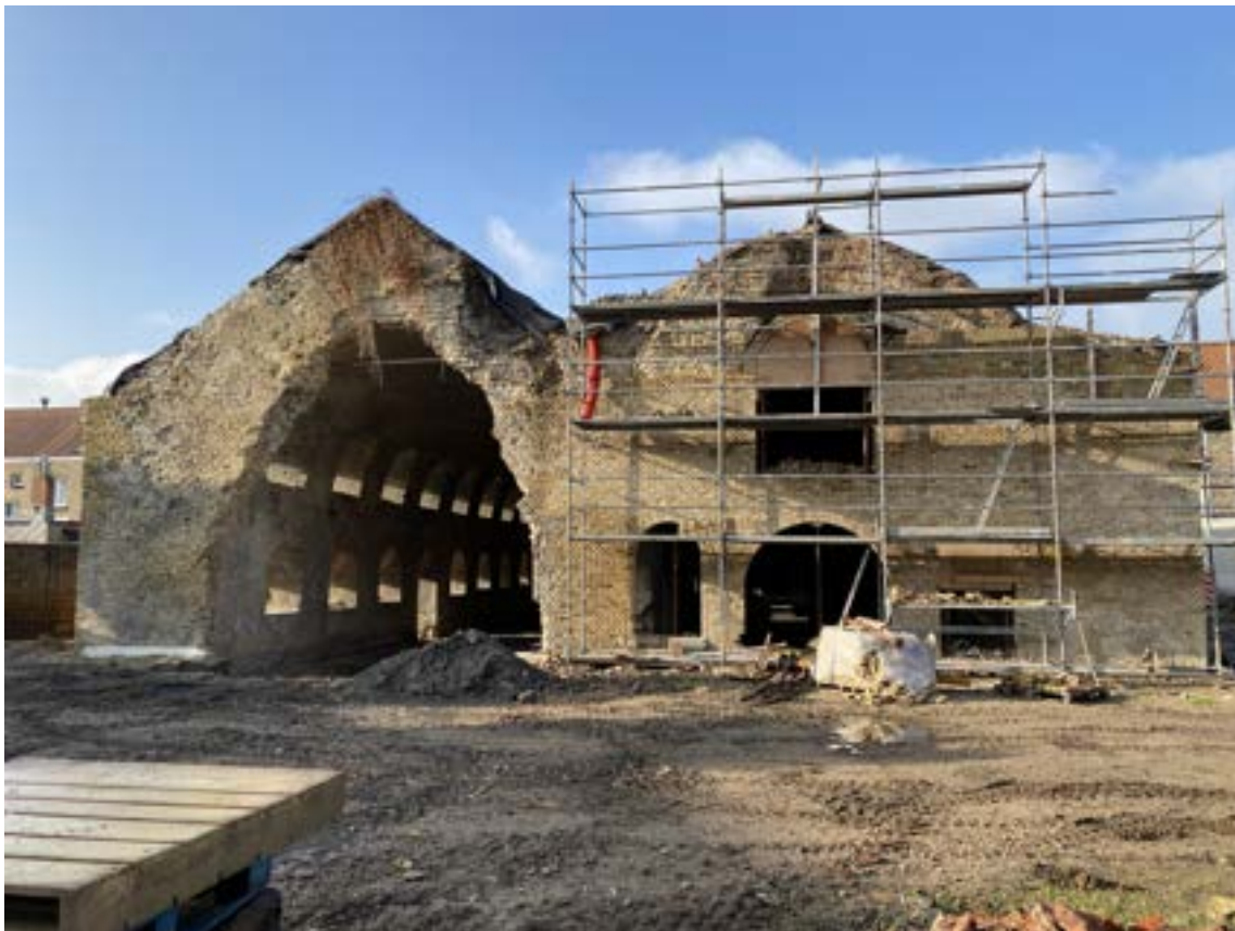
De oostelijke gevels, zijde front, waren door de beschietingen in WO1 fel beschadigd en nadien vluchtig hersteld. Ze worden nu naar het oorspronkelijke uitzicht hersteld.