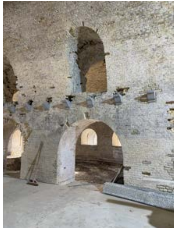
Het interieur van de zuidelijke opslagplaats tijdens de restauratie. In de muren zijn de consoles voor de houten tussenvloer bewaard. Ze worden door een betonplaat vervangen. Ontdaan van hun verdieping krijgt het geheel piraneske allures.