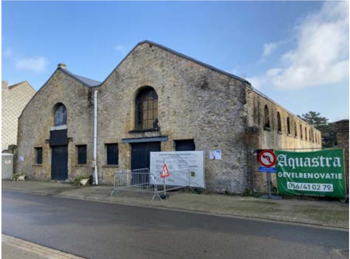
Het Bommenvrij in restauratie, december 2025

Het Arsenaal 'Het Bommenvrij' in Nieuwpoort Friede Lox en Johan Termote