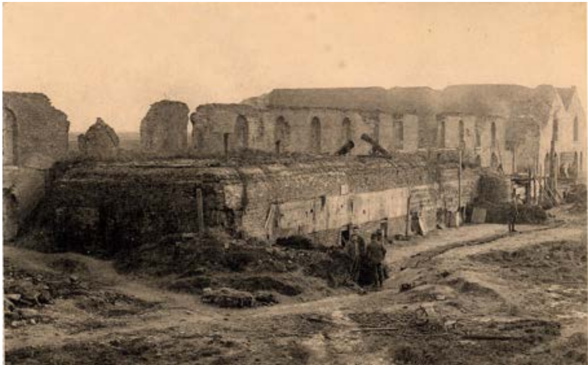
De Schoolstraat tijdens de Eerste Wereldoorlog. Rechts het Bommenvrij, links de resten van het vernielde niet bommenvrij Arsenaal met daarvoor een ruime bunker, aangelegd in de Schoolstraat. Na de oorlog verrijzen op de plaats van het vernielde Arsenaal en de bunker een rij arbeiderswoningen.

Door hun bomvrije constructie doorstonden het Arsenaal van het Bommenvrij en de kruitmagazijnen de beschietingen van de Eerste Wereldoorlog. Tijdens het interbellum sloopte men twee van de kruitmagazijnen. De zwaar beschadigde toren van Sint-Laurentius was door de beschietingen van de batterij Tirpitz in 1917 tot 1/3 van zijn hoogte herleid. De ruïne ervan bleef bewaard als een getuige van de oorlog.