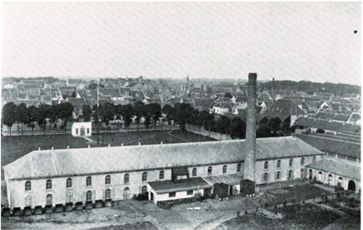
Twee foto's genomen vanop de toren van de Sint-Laurentius met zicht op het gewezen oefenterrein en de aanpalende resten van de militaire gebouwen. ca.1900. Op de bovenste foto is nog het Oostenrijkse Geniedepot (1), het Hollandse kruitmagazijn (2) en het Bommenvrij (3) te zien. Op de onderste foto: het niet bommenvrije Arsenaal, herbestemd als fabriek